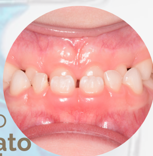
morso crociato anteriore